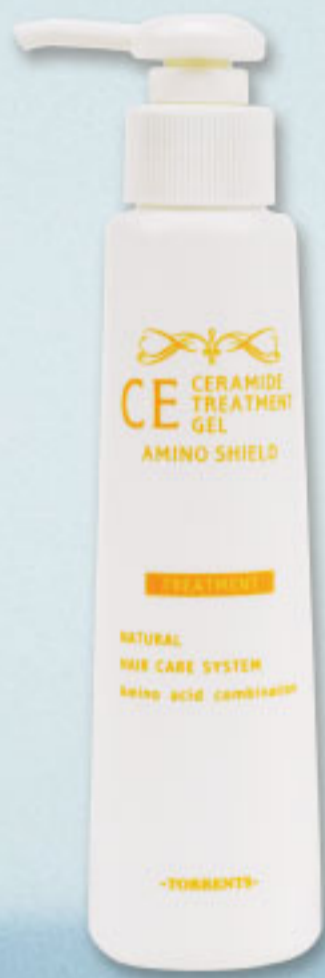
OUT BATH TREATMENT